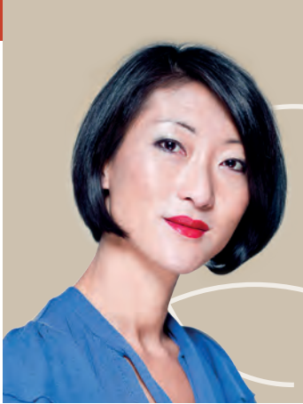
Fleur Pellerin, ministre déléguée auprès du ministre du Redressement Productif, chargée des Petites et Moyennes Entreprises, de l'Innovation et de l'Économie numérique

Libérer les énergies de notre pays, c'est mon objectif quotidien et celui du Gouvernement. Les Assises de l'Entrepreneuriat ont montré au printemps dernier que chaque Français est capable de porter un projet et de créer des emplois. Un choc de simplification pour permettre à chaque PME de penser à son métier plutôt qu'à ses papiers. Un choc de simplification pour l'essor du crowdfunding, le financement direct de jeunes entreprises par chaque citoyen grâce à internet, qui draine déjà 5 milliards d'euros dans le monde. La France sera à la pointe de cette révolution, grâce à la modernisation de son ancienne réglementation bancaire. Un choc de simplification pour ouvrir la voie aux vocations d'entrepreneurs, multiplier le potentiel d'innovation de notre pays et faciliter l'investissement dans les infrastructures de demain.