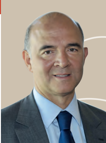
Pierre Moscovici, ministre de l'Économie et des Finances